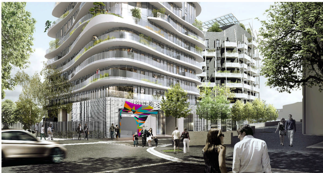
Esquisse de projet pour l'accès à la station Pont Cardinet , Paris, 2014 (pré-visualisation) © Tobias Rehberger

Groupe EMERIGE ; RATP ; Ville de Paris ; STIF.